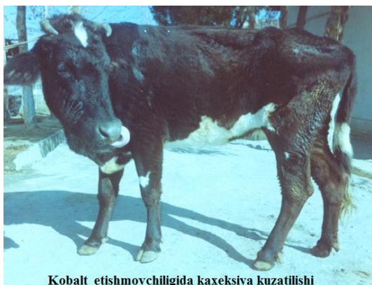
Kobalt yetishmovchiligida kaxeziya kuzatilishi

Rivojlanishi. Kobaltning organizmga talab etiladigan darajadan kam miqdorda tushishi siankobalaminning mikroba sintezining kamayishi, gemopoezning buzilishi, mikrositar va megaloblastik gipoxrom anemiyaga sabab bo'ladi. V 12 vitamini tanqisligi kuzatilganda folat kislotasini uning metabolitik faol shakli hisoblangan tetragidrofolat kislotasiga aylanishi qiyinlashadi. Oqibatda qon hosil bo'luvchi hujayralarda, xususan eritro- va normoblastlarda DNK sintezi izdan chiqadi. Bu hujayralarning bo'linishi va yetilishi sekinlashadi. Gemopoezning izdan chiqishi to'qima va a'zolarida oksidlanish - qaytarilish jarayonlarining sekinlashishiga olib keladi. Kobalt transmetillanish reaksiyalarida qatnashadi, arginaza, karbongidraza, aldolaza, ishqoriy fosfotaza kabi fermentlarni faollashtirib, ular oqsillarning mikroba sintezi uchun zurrur hisoblanadi. Shuning uchun kobalt yetishmaganda oziqalar tarkibidagi proteinning o'zlashtirilishi yomonlashib, manfiy azot balansi rivojlanadi, ya'ni organizmdagi zahira oqsillar ishlatila boshlaydi va oqibatda kuchli oriqlash (suxotka) kuzatiladi.