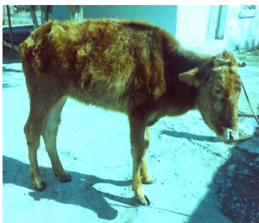
МИКРОЭЛЕМЕНТОЗЛАР БИЛАН КАСАЛЛАНГАН СИГИР