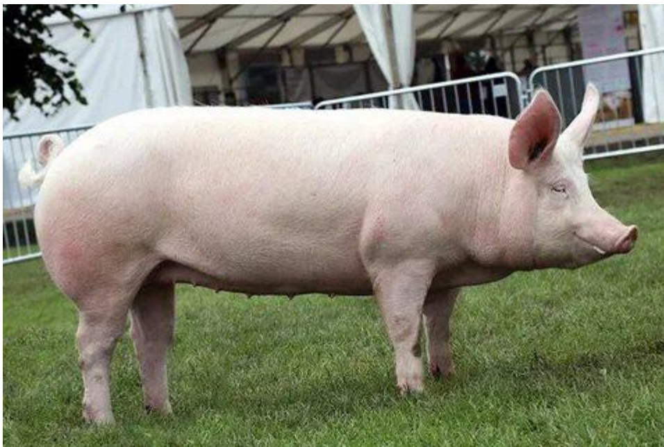
Yirik oq Cho‘chqa.

Hozir urchitilayotgan yirik oq cho‘chqalarning go‘sht, go‘sht – yog‘ yo‘nalishidagilarini kuzatish mumkin.