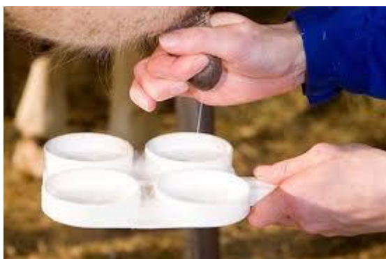
46-rasm. MKP-2 plastinkasiga sut namunasi olish.

Dimastin bilan sinama o‘tkazish uchun distillangan yoki qaynatilgan iliq holdagi suvda 5%-li eritma tayorlanadi. Har bir chuqurchaga o‘ziga tegishli yelin bulagidan 1 ml sut sog‘iladi va pipetka avtomat yordamida 1 ml dimastin eritmasi solinadi. Navbati bilan har bir chuqurchadagi aralashma shisha tayoqcha yordamida 10-15 sekund davomida aralashtiriladi. MKP-2 plastinkasidan foydalanilganda aylantirish bilan hamma chuqurchalardagi sut bir vaqtda aralashtiriladi. Sinama natijasi hosil bo‘lgan ivimaning quyugligi va ranggiga ko‘ra baholanadi. Ivima hosil bo‘lishi - sutni dimastin yoki mastidin bilan tekshirishda asosiy diagnostik test, aralashma rangining o‘zgarishi esa ikkilamchi darajali ko‘rsatkich hisoblanadi.